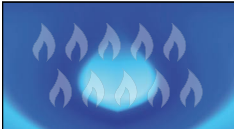
Abb.: Bei Plasma-TVs werden die Bilder mithilfe von Gas erzeugt. Jeweils drei Kammern (für Rot, Grün und Blau) ergeben ein Pixel.